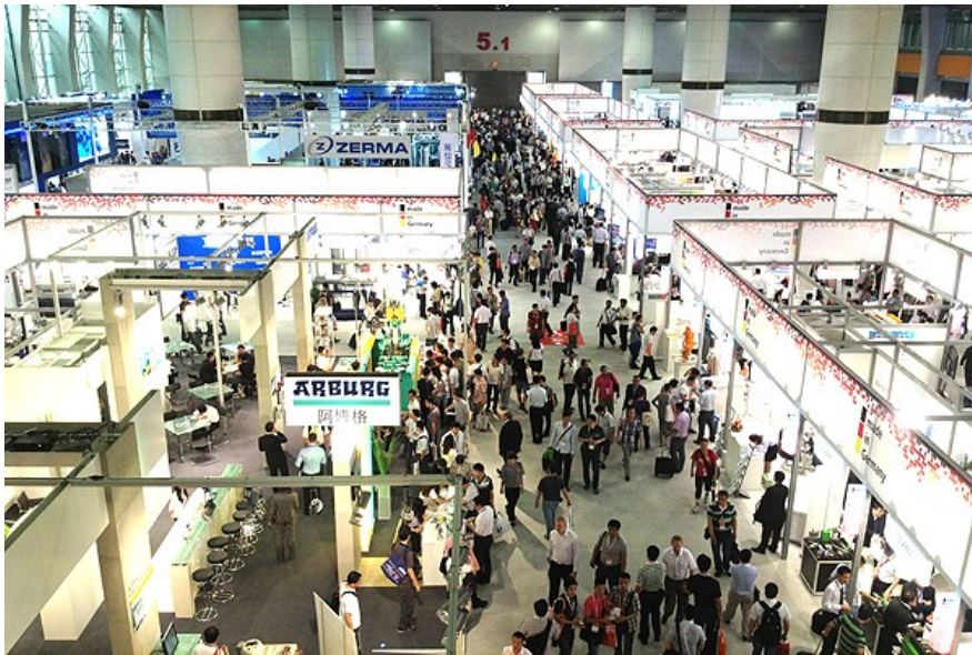
Blick auf den deutschen Pavillon

Auf der Chinaplas in Guangzhou war auffällig, dass der Qualitätsanspruch der Chinesen wächst und es eine größere Nachfrage nach Automatisierung gibt. Die 25 Hallen mit 2.900 Ausstellern waren prall gefüllt. Der deutsche Pavillon mit 140 Ausstellern wie den Maschinenherstellern ARBURG, Krauss Maffei, KAUTEX, BOY war bis dahin der größte.